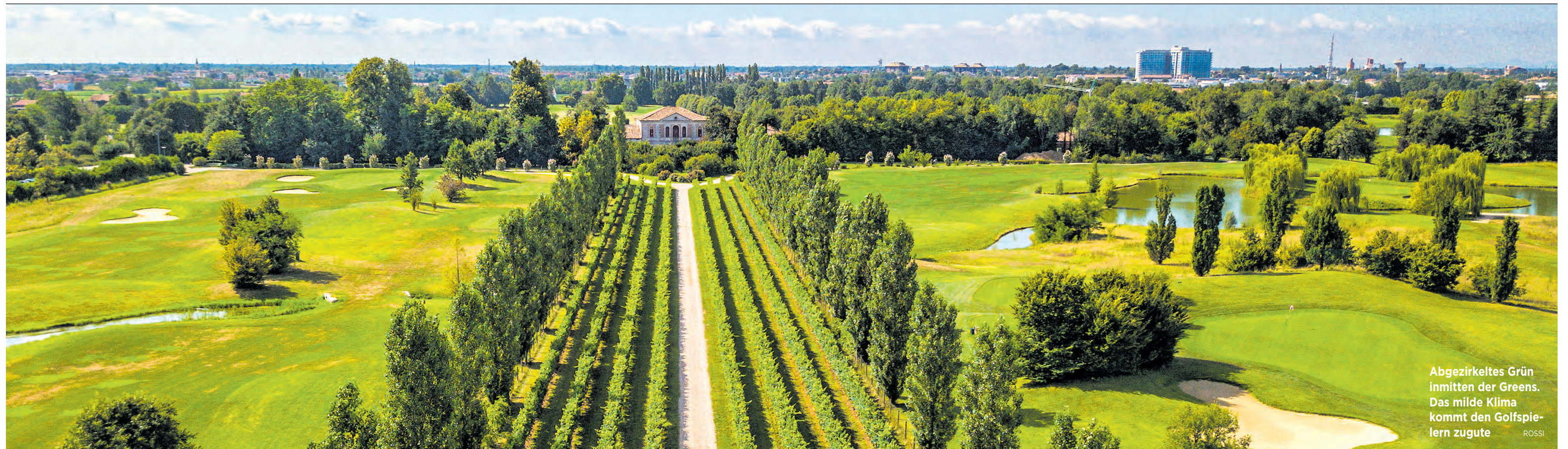
Abgezirkeltes Grün inmitten der Greens. Das milde Klima kommt den Golfspielern zugute