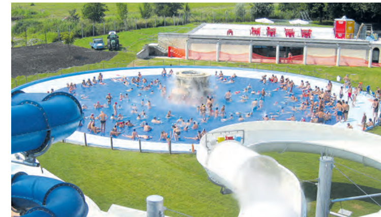
Auch für Kinder gibt es in den Thermen des Veneto coole Angebote. Rutschen und Wasserfälle gehören dazu

tenden Behandlungen wie Ayurveda, Shiatsu, Hot-Stone Massage, Aroma- und Antistress-Therapien, sowie Gymnastik und Yoga-Kurse ergänzen den Therapieerfolg. Wie effektiv der Jungbrunnen wirkt, zeigt ein Blick ins Besucherbuch vergangener Tage: Unter den Gästen weilte auch Kaiserin Elisabeth von Österreich.