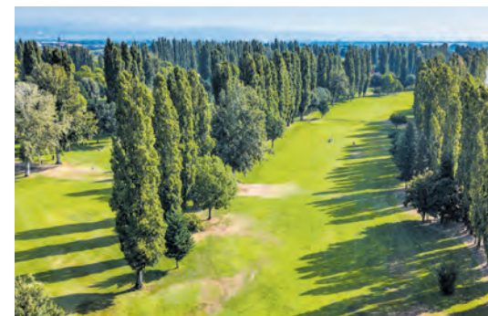
Die wachsende Besucheranzahl ist von der erbau-lichen Natur und der familiären Atmosphäre fasziniert ROSSI