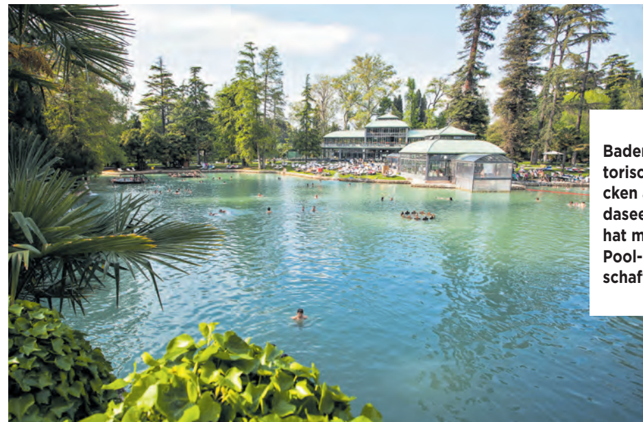
Baden in historischen Becken am Gardasee. Spaß hat man in der Pool-Landschaft KK (5)