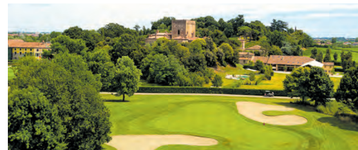
Bistro und Gourmet-Snack-Bar stillen den kleinen Hunger