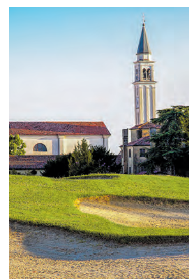
Highlights der venetischen Küche im Golfrestaurant