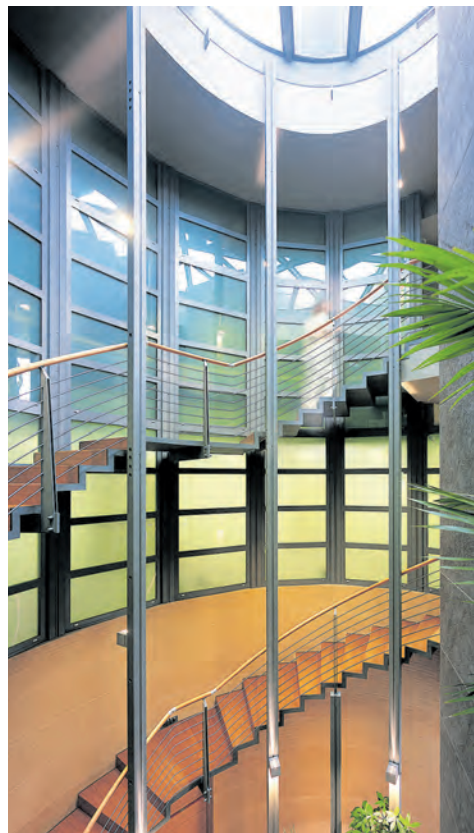
Warmes Wasser streichelt Körper und Seele. Moderne Hotelanlagen und geschultes Personal sind die Pluspunkte