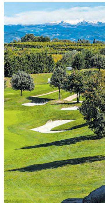
Städtchen wie Peschiera, Sirmione, Lazise und Garda sorgen für Abwechslung ROSSI

Baden im Gardasee und golfen auf einem der schönsten Plätze der Region - im Golf-Club Paradiso del Garda.