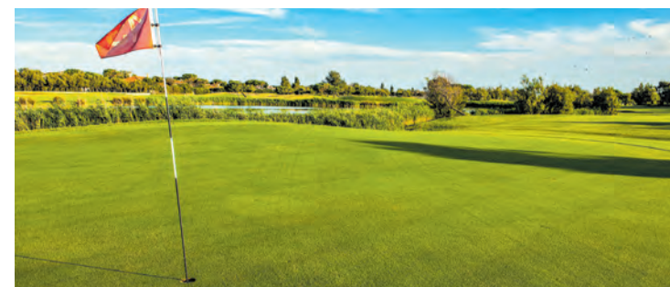
Ein flacher Platz nahe dem Meer, auch für Anfänger ROSSI

Natürlich werden auch Kurse für Anfänger und Fortgeschrittene angeboten oder in den Sommerferien Clinics-Kurse für Jugendliche.