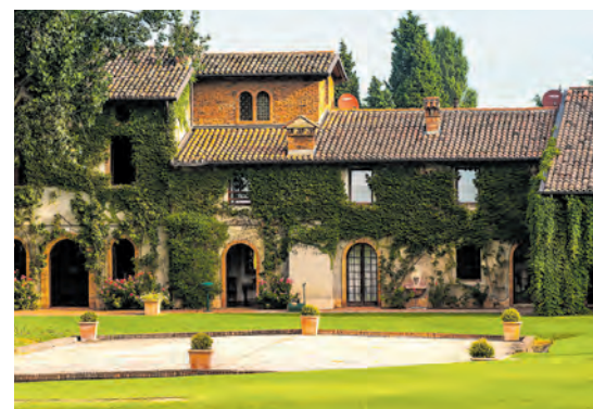
Nach einer Golfrunde bricht die Zeit für Weißweinliebhaber an: Ein Besuch der Cantina de Custoza ist immer ein Erlebnis ROSSI

Eingebettet in eine üppige Vegetation erwarten die Spieler auf