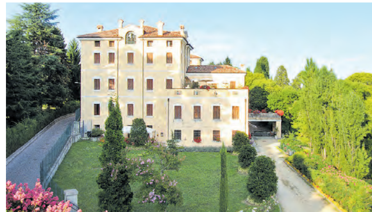
In Kontakt mit historischen Villen in den Hügeln von Asolo. Kultur vereint sich mit Natur und Thermalkuren

Der berühmte Gardasee vereint sein spezielles Klima und die wunderbare Landschaft mit etlichen Thermalquellen. Der 13 Hektar große „Parco Termale del Garda“ ( Terme di Lazise ) ist ein „Natur-Spa“ mit seltenen Pflanzen und Jahrhunderte alten Bäumen, darunter viele ausladende Zedern. Das Mineralwasser der „Villa die Cedri“ stammt aus zwei verschiedenen Quellen, die sich in 200 Meter Tiefe befinden.