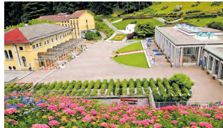
Das Thermalwasser von Recoaro ist ein Labsal für Menschen mit Lungenproblemen, fein zerstäubt wirkt es wohltuend

Zwischen Bassano del Grappa und dem Proseccogegebiet Valdob-