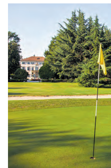
Golf und venezianische Köstlichkeiten

Im Fünfsterne-Hotel Villa Condulmer lassen sich entspannte Tage beim Golfspielen verbringen. Ganz in der Nähe sorgen die Kulturstädte Venedig, Padua und Treviso für viel Abwechslung. Auch die Thermalbäder von Abano und Montegrotto sind nicht weit und bieten herrliche Entspannung im warmen Wasser.