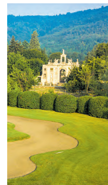
Trolleys und Golf-Bags können im Club-Haus ausgeborgt werden

Der Golf-Club Padua mit seinen 27 Holes ist wegen seiner technischen Herausforderung unter den zwölf besten Plätzen Italiens gelistet. Kein Wunder, wurde er doch vom berühmten Golf-Architekten John Harris vom Cotton Studio in London designt. Der 18-Loch Par 72-Kurs windet sich rund um die Euganeischen Hügel und besticht durch die landschaftliche Schönheit. Der erste Eindruck ist die Harmonie zwischen Technik und Naturerlebnis. Der Club ist Mitglied des Projekts „Engagiert für Grün“ (Committed to green), das sich um den Schutz der Umwelt kümmert. Der Kurs, mit einer Länge von 6095 Metern, ähnelt einem botanischen Garten mit 8000 Bäumen, Büschen und allerhand mediterranen Gewächsen.