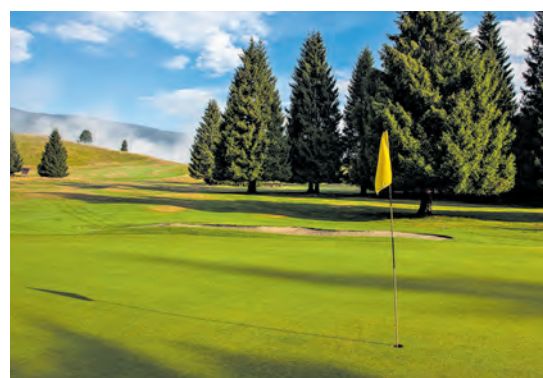
Der Platz bietet einige Herausforderungen für Spieler, beträgt seine höchste Erhebung doch 1027 Meter

Um die ersten neun Löcher zu planen, holte man den englischen Architekten John Harris. Wegen der Herausforderung und landschaftlichen Schönheit des Platzes kamen die Golfspieler aus ganz Italien. Der stetige Zuwachs an Clubmitgliedern machte in den Neunziger-Jahren eine Erweiterung auf 18 Löcher notwendig. Sie wurden von keinem Geringeren als Marco Croze geplant.