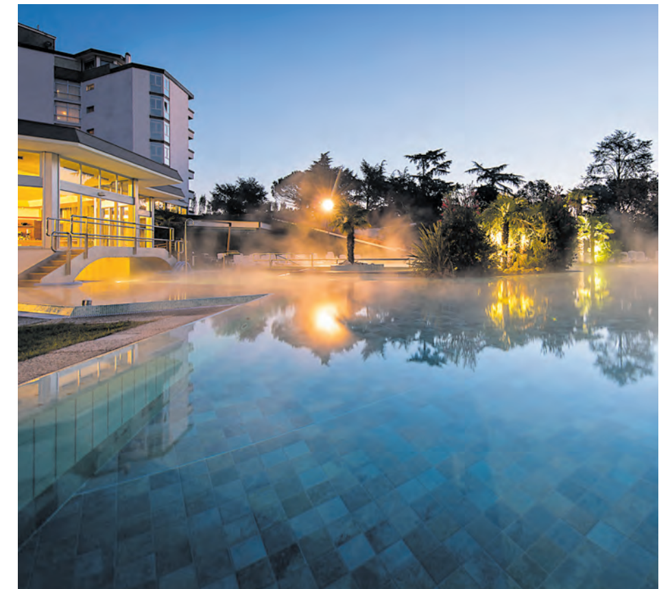
Mediterranes Klima, südliche Vegetation und zeitgemäßer Komfort machen die Thermen der Euganeischen Hügel zu den beliebtesten Europas