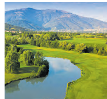
Ein Genuss für Golf- und Kulturliebhaber