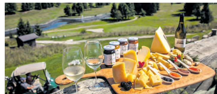
Nicht nur von Profis zu bespielen: der Asiago Golf Club

Apropos: Die international bekannten Champions Edoardo Molinari und Renato Paratore sind die Botschafter des Golf-Clubs Asiago in der Welt.