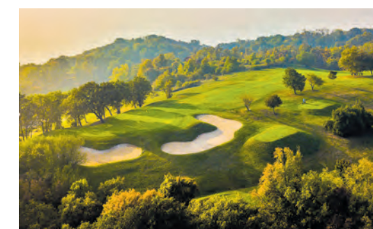
Der Golfplatz liegt nahe Vicenza, der Geburtsstadt des Renaissance-Architekten Palladio