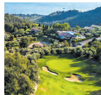
Golfvergnügen eingebettet in einen grünen Olivenhain ROSSI

Ein Tipp: Der Golfclub Ca' degli Ulivi veranstaltet jeden Sonntag ein Golfturnier.